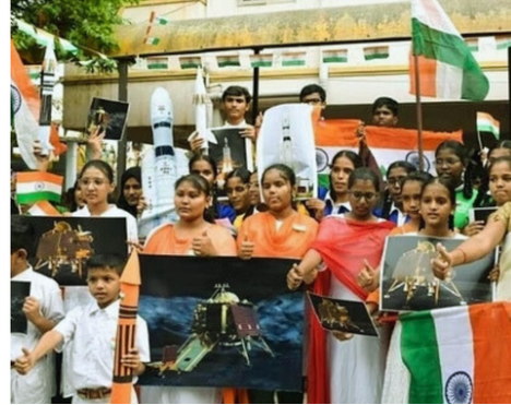
Vikram as seen by Pragyan August 30, 2023, 07:35 Hrs. IST